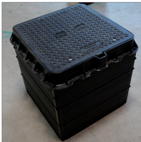
ROM-Box 60/60 mit Abdeckung