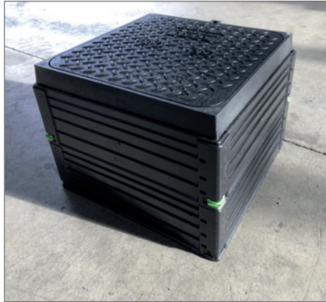
ROM-Box 405x405 mit Abdeckung