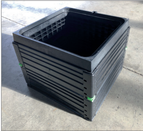
ROM-Box 40/40 mit aufgeschraubtem Rahmen

Kunststoff-Abdeckung mit Verriegelung, Bauhöhe = ca. 60 mm. Die ROM-Box mit LW 405x405 wird komplett aus Spritzgussprofilen mit glatter Außenwand gefertigt. Es wird keine Schalungshilfe und Höhenausgleich verwendet. Der fix montierte Rahmen der Abdeckung wird mittels Edelstahl-Schrauben direkt auf die ROM-Box geschraubt. Der Deckel wird durch 4 Kunststoff-Schrauben gesichert. Außenmaße: 485 x 485 mm. Gesamthöhe der ROM-Box GALA 40 40: 460 mm.