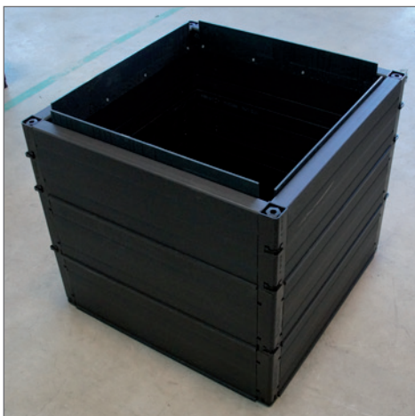
ROM-Box 60/60 mit Innenschalung

LW 600x600 mm. Der Einsatzbereich dieser ROM-Box mit Composite Abdeckung ist auf Anwendungen bis Gruppe 2 (EN 124, Klasse B 125) beschränkt! Kunststoff-Abdeckung mit 2-fach Arretierung aus Edelstahl, Bauhöhe Abdeckung = ca. 100 mm. Die ROM-Box mit LW 600x600 wird komplett aus Extrusionselementen gefertigt, d.h. glatte Außen- und Innenwand. Eine Innenschalung wird mit Überstand zum obersten Profil befestigt und dient als Verschiebesicherung des Abdeckungsrahmen. Getrennte Lieferung von Schacht und Abdeckung, keine fixe Montage. Außenmaße: 680 x 680 mm. Die ROM-Box GALA 60 60 wird in 2 Höhen angeboten: Gesamthöhe 700 - 750 mm oder 800 - 850 mm.