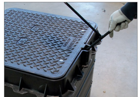
der Abdeckung mit US-3 ROM-Box SD